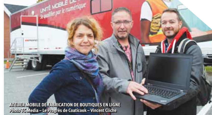
ATELIER MOBILE DE FABRICATION DE BOUTIQUES EN LIGNE

La SADC met à la disposition des entrepreneurs de la région de Coaticook deux volets d'intervention, soit le financement et le service-conseil.