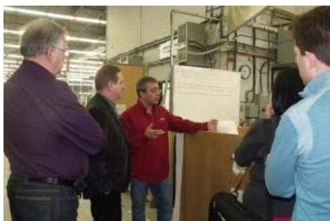
Les entreprises Niedner et JM Champeau ont ouvert leurs portes à une quarantaine d'étudiants de l'Université Bishop's, le 19 février dernier.

0 Commenter | Envoyer à un ami | Imprimer